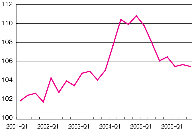
図1 全国不動産価格指数の推移 (四半期, 前年同期=100)