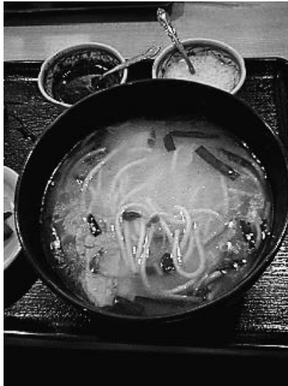
都内某店の具をすべて入れたあとの過橋米線

中国では小麦粉で作られた食品（麵、餃子、マントウなど）を総称して麵食と呼ぶ。気候、地形、土壌、農産物の関係から長江を境に、北は麵食、南は米を主食とする2つの食文化に分かれる。簡単にいえば、北は麵類、南は米類といえる。とはいえ餃子は中国全土で食べられるし、麵類も同様だが、南は米を使った麵類が多い。有名なのは台湾・香港で食べられるビーフン（米粉）だ。西南地域に行くとビーフンは米線と呼ばれるようになる。とくに有名なのは雲南名物の過橋米線（かきょうべいせん）である。スープと麵と具が分かれており、具には、鶏や豚の薄切り、中国ハム、モヤシ、ニラなどいろいろな種類がある。油が熱くなっているチキンスープに、すべての具をいれて余熱で火を通し、その後麵を入れていただくのである。西北には甘肅の蘭州ラーメン（拉麵）があり、牛肉のあっさりスープと引張って作った小麦粉麵が有名であり、日本人にもなじみが深い。西南は過橋米線がおすすめである。ぜひ一度ご賞味あれ。