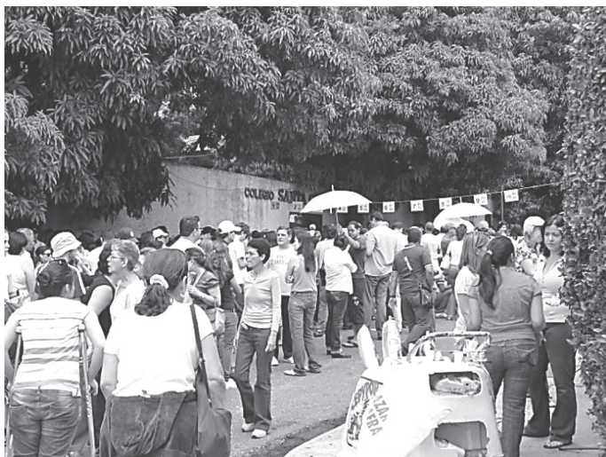
近年の国政選挙では高い投票率が続く。2010年9月国会議員選挙で長蛇の列で投票の順番を待つ有権者