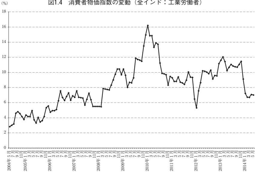
図1.4 消費者物価指数の変動（全インド：工業労働者）