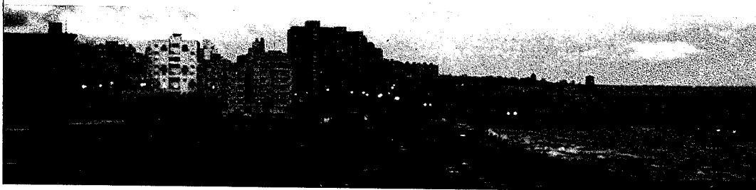
ラプラタ河沿いの海岸通り(モンテビデオ市)