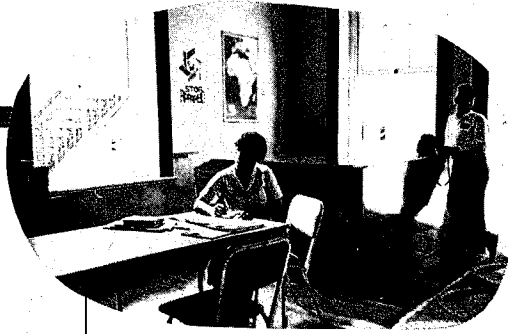
木造二階建ての グブアフリカ・カリ ストン市

ろがっており、市内の移動は車に頼るほかない。市内のアパートは、サンパウロのそれらと同じに、治安に対する心づかいに満ちている。窓には格子がはめられ、駐車場の出入口は巨大な格子扉が開閉する仕組みになっている。官庁がダウンタウンから徐々に山の手に移ってきていて、中心街に近い中央銀行ではパスポートの呈示を求められる。しかし人々の応待は親切である。ベネズエラの地名には土地のインディオの用いた名称が多いせいも、逆に土地鑑をつかむのに苦労する。うす茶色の肌をした人びとが空港でもホテルでもきびきびと働いている。職をもとめて近隣の国から流入する白色民が多いときく。