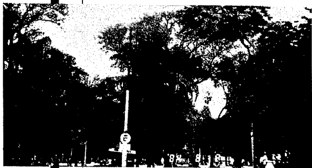
ハカラランダの樹木。淡紅色の花が咲いている(アスンシオン市)

う風情で家々に辻々にたたずんでいた。息をのむようなその悲慘は私に写真にとることをためらわせ、しかも人々はそこに居ることが旅人をうちのめした。