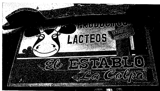
カハマルカ市郊外、コルパ農場の直売所(上)とアルプス農場のチーズ工場(左)

観光客の増加を目指して、従来の観光地の振興はもちろん、新しい観光資源の開発も行なわれている。本稿ではそのうち、農業や農村の開発と観光を結びつけた「アグロツーリズム」を取り上げ、政府機関や大学、開発援助機関による試みを紹介する。