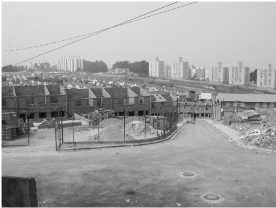
サンパウロ市の自主管理ムチラン建設現場（筆者撮影）