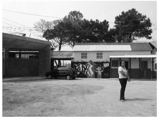
コミュニティの連帯感を高める共同作業場

市で実施された都市貧困層向け住宅政策の事例を紹介し、その可能性と限界について考察を試みるものである。