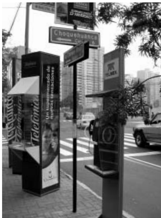
リマ市内にはライバル企業の公衆電話が立ち並び。

このような通信産業の民営化による市場の競争は、首都圏をはじめとした都市部の電話サービスの向上に貢献したと考えられている。しかし、ペルーの電話普及率は他のラテンアメリカ諸国に比べると低く、特に農村部における電話の普及が課題となっている。本稿では民営化以降のペルーのテレコム産業における外資系企業の参入と競争の状況を説明する。続いて民営化による消費者と企業への利益を見たうえで、重要な課題の一つとして残されている農村部への電話の普及に関する取り組みを紹介する。