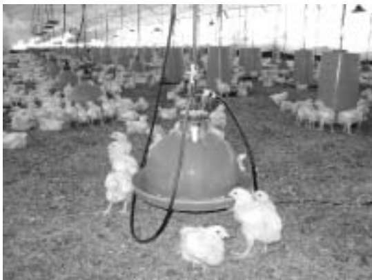
鶏舎内で成長するブロイラー

世界的に食料価格が上昇する中、ペルーでは鶏肉価格の上昇が注目を集めている。ここ数年1キログラム当たり5.5～6.0ソル(1ドル=約3ソル)の小売価格が、2008年7月に6.0ソル、8月に7.0ソルを超え、8月末には7.5ソルに達した。わずか数カ月で2割以上の価格上昇である。鶏肉は家計支出の4%弱を占め、コメやパンを上回って家計の中で最も支出額が多い食料品である (1) 。そのため、この価格上昇は新聞などのメディアで大きく取り上げられたほか、大手養鶏企業による価格カルテルの疑いも持ち上がった。業界団体はこれを否定し、国際市場における飼料原料や燃料の高騰が生産コストを押し上げたこと、さらに好調な