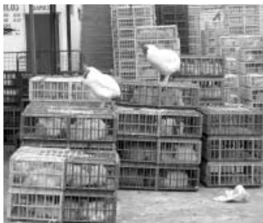
リマ市内の生鳥卸売市場(サン・ルイス地区)

リマ市周辺で養鶏企業が生産する鶏は、主に次のような経路で流通する(図2)。鶏が出荷体重に達すると、養鶏企業は卸売業者に鶏を販売する。卸売業者はトラックと労働者を手配して深夜に鶏舎で鶏をカゴに入れて、早朝までにリマ市内に十数力所ある生鳥卸売市場(centros de acopio de aves vivas)に運ぶ。ここで小分けにして、朝までに小売店に配達する。生きたままカゴに入った状態で小売店に配達するほか、市場内の解体処理場で中抜きと体(屠体)にする。中抜きと体とは、鶏をと