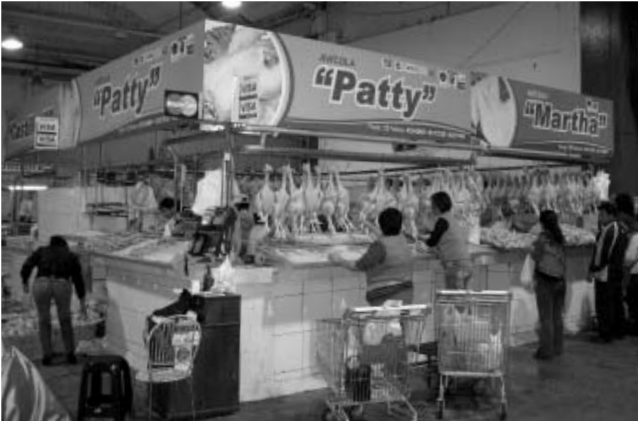
鶏を丸ごと販売する鶏肉販売店(リマ市に隣接するカヤオ区ミンカにて筆者撮影)

日本や米国ではほとんどが解体処理された後に販売されるが、ペルーでは生体のまま卸売業者へ販売される割合が多いのが特徴である。2007年の統計によると、政府機関が承認した主要都市にある解体処理場と殺された鶏肉は、全国で生産された鶏肉の22%にあたる(MINAG[2008])。これらのほとんどは大手企業の解体処理場である。よって、残りの8割弱が生体のまま卸売業者へ販売されていることになる。大手養鶏企業によれば、この数字は1990年代初めから70~80%で推移しており、生体での販売が減少している傾向は見られない。1990年代末に大手養鶏企業は解体処理や加工する鶏の量を増やしているものの、鶏肉全体の生産量が増えているために、生体販売の割合も変わっていないという (11) 。