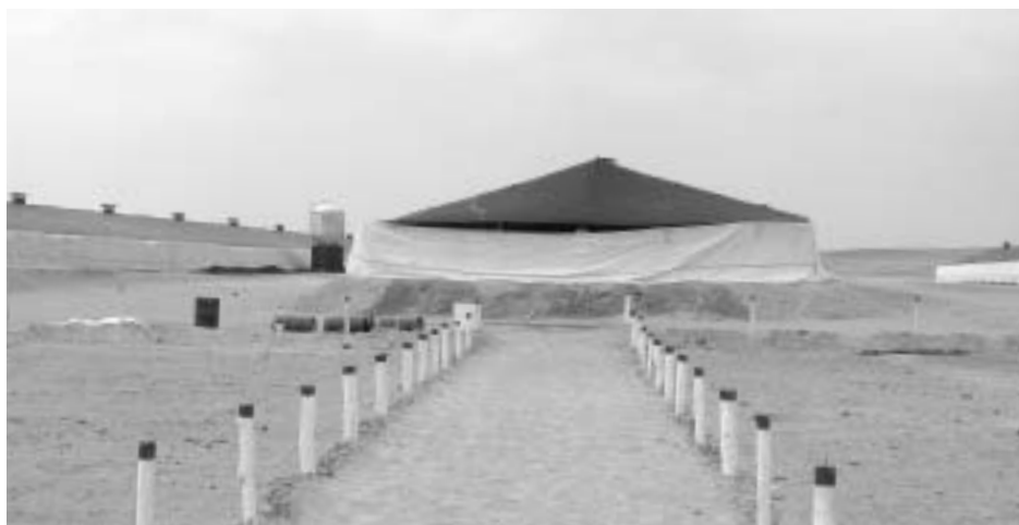
砂漠に位置する鶏舎は木造で壁がなく、幕の上下で温度を調整する

2000年に実施された牧畜業センサスによると、ペルーには695の養鶏農場がある（MINAG[2001]）。このうち、養鶏生産が盛んなのは海岸地域と熱帯低地地域である。州別では、首都のあるリマ州に生産が集中しており、農場数では3割にすぎないが、飼育羽数では6割に達している。これに海岸地域の北部にあるラ・リベルタ州、リマ州の南にあるイカ州を合わせた3州がペルーにおける養鶏生産の中心地で、飼育羽数の88%を占めている（表2）。また、農場当たりの鶏舎面積を比較する