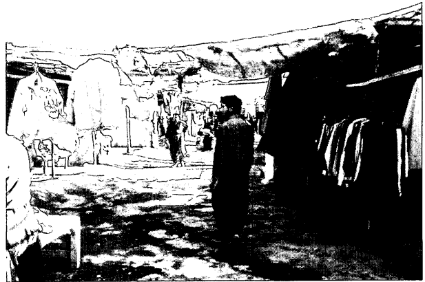
マハーバードのバーザーレ・タナクラ。イラク経由の古着を格安で大量に売っている。

マハーバードにこのバーザーレ・タナクラが出来たのはイラン・イラク戦争末期のことであるらしい。イランの他の町では考えられないほど古着を大量にしかも格安で売っているということで、テヘランなどでも次第に評