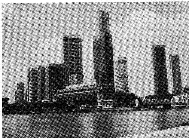
シェントン・ウェイ・ビジネス街の高層ビル群