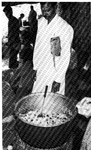
—膳飯屋のビルヤーニー—

ナーイーは通過儀礼の一部を担っていることになる。ナーイーが結婚披露宴などの料理人となるのも通過儀礼の一端を担ってのことではあるまいか。それはともかく、ナーイーがデーグで作ったビルヤーニーなどがいかに美味なものであるかは、食べた者にしか分からない、と自慢したくなる。