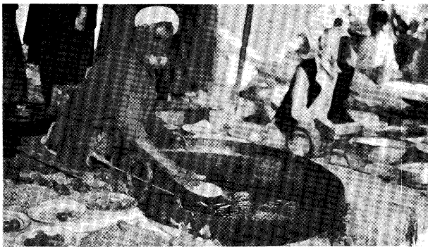
北西辺境州パターン人のチャプリー・カパーブの味も一度食べたなら忘れられない。

パキスタンでは結婚披露宴などのパーティーをテントを張って戸外で行うことがよくある。百人も二百人も入る超大型テントには色彩豊かな模様が描かれており、テントの外側には色とりどりの豆電球がびっしり。