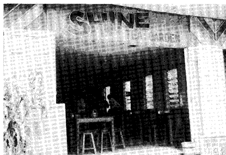
経済の自由化に伴い新しいレストランも 店開きし始めた。

で、昼食時には、お客が居るにもかかわらず、弁当を食べている姿をよく見掛ける。まことに、ほほえましい光景ではあるが、待たされる者にとっては腹立たしい。 外食産業の発展は、その国の経済発展、それに伴う生活の近代化によるものであるとすれば、外食産業の状況からみても、この国はまだ前近代的な経済・社会から抜けきれていないと言えるだろう。