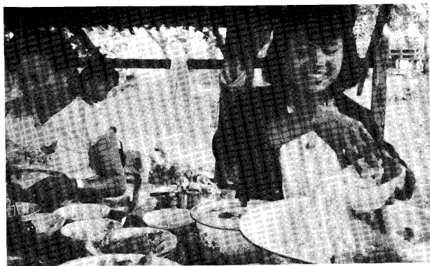
最もポピュラーな朝飯 “モヒンガー”