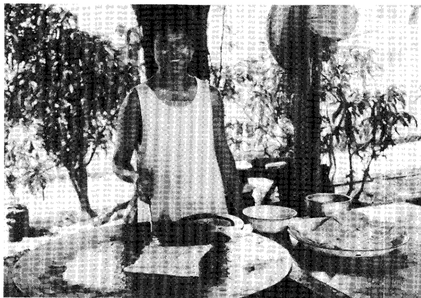
インド風揚げパン “パラダ”

ティンティンエイ、チェメンダイン街のウーパジーという店が繁盛しており、朝も八時になれば売切れ閉店となる。こうしたいわば有名店も各地にあるが、大方のモヒンガー店は、ニッパヤシの屋根と竹の柱でできた粗末な小屋掛けか、露天である。いずれにしてもモヒンガーはこの国の外食産業の花形である。