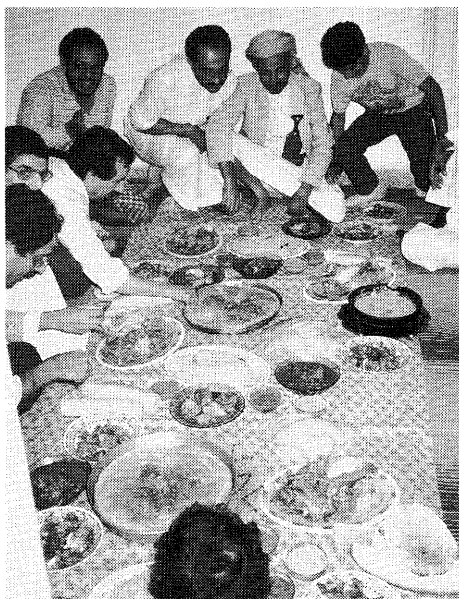
サナアに住んでいる同郷者が、たまの金曜日に「叔父さん」の家に集まって食事をする。広範囲の親戚が集まるので一種の同郷会の雰囲気である。

持ち帰る。「××村サナア出張所」のようになる。それが親戚であり、叔父さんの役目なのである。少しくらい遠い親戚だからといって、頼ってきた者を追い返したりするのは、恥である。人が集まることは、その家の主人の寛大さと度量の広さを示す指標なのである。