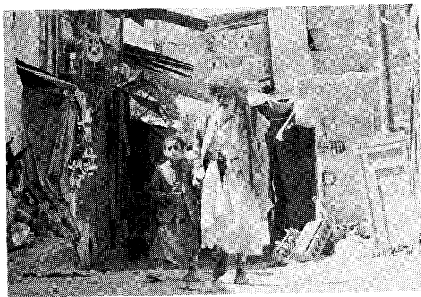
町なかを歩くおじさんと孫の組み合わせはよく見かける。甘える孫ではなくおじさんを敬い、かつかばいながら歩いている。

生死をかけた戦闘が日常茶飯事であるこの社会で、ここまで生き延びてきたからだろうか、イエ