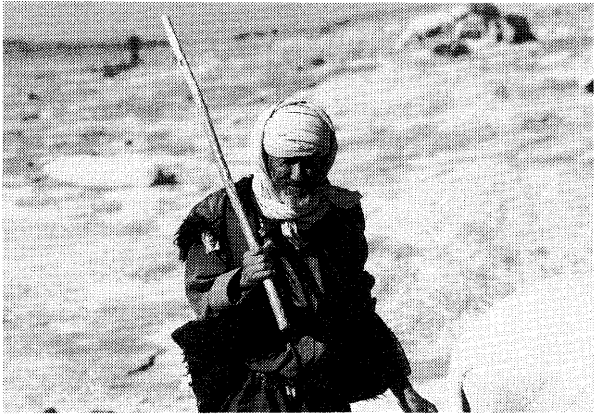
農夫。杖を持つ手、深い皺、そしてターバンの巻き方まですべてが絵になる姿である。

ど与えられなかった場合が多い。なにしろ革命の起こった一九六二年まで女学校など皆無だったのだ。女性の高学歴化、有職化が進み、女性がますます子供を産まなくなっている日本と、イエメンのような国と同じ星の上に存在していることがときどき不思議に思えることもある。遠いとはいえ、一万キロ。飛行機を乗り継いで一昼夜の距離である。