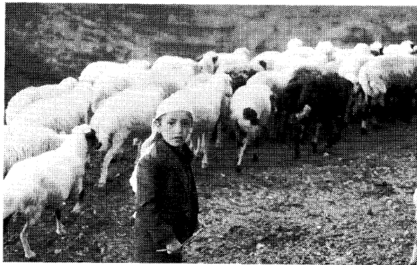
羊飼いの少年。手に持つ木の枝1本と自分の声で羊の群れをコントロールする。音を出すためにブリキのバケツを持っていることもある。

一つは、ハジャラの村はそんなに貧しい村ではないこと。生活のために子供が観光客相手に物を売らなくたって生きていけるし、生きてきたのである。もう一つはその土産がひどくいい加減なものであったこと。本物であれば、まだ許せる。どうしてこんなものを作るようになったのだろう。たぶん先週や