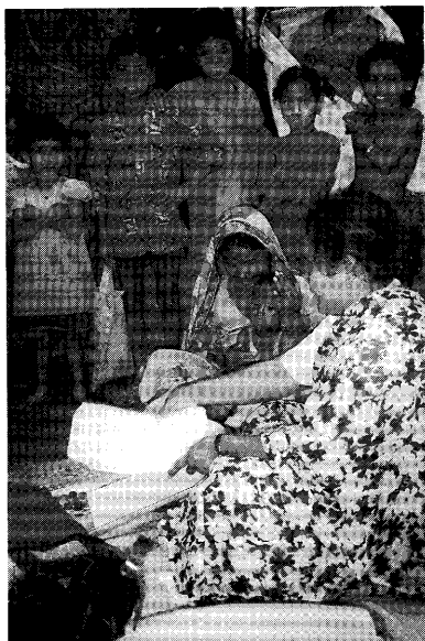
女性保健ワーカー（手前）が村人の家を訪れる（バングラデシュ：ボグラ県）

ボランティアとは「ボランタリイな人」と言う意味であり、ボランタリイとは「自発的」という意味である。つまり、先に挙げた要素①の有志のこと、自分の価値判断と意志に従って、自発的に何事かを行う人のことである。