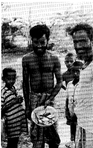
村人が自分でとった小魚を見せてくれる (バングラデシュ; イシヨルゴンジ県の農村)