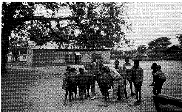
モザンビーク人難民キャンプの子供（ジンバブエ・チブエにて。撮影：山田文恵）