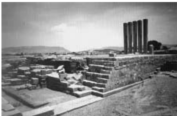
ビルキース神殿。この石柱列の廃墟は、シバ王国の神殿とされており、シバの女王ビルキースの名を冠して記憶されている。（マーリブ）

しかしながらこうした規制は、一九九五年に世界銀行、国際通貨基金（IMF）の指導による「構造調整」が始まり、固定公定レートが廃止されて一ドル＝一〇〇リヤル以上という実勢レートが成立すると現実的でなくなる。この結果九七年当時の一〇〇リヤル札の値打ちは八三年の五〇分の一になってしまった。さすがに最高紙幣の価値が一〇〇円では経済活動に支障が出るので、まず二〇〇リヤル札（表に古代の立像、裏にハドラマウトの港町ムカッラの景色）、九七年には五〇〇リヤル（表に中央銀行、裏にシバの女王の宮殿跡）、一〇〇〇リヤル