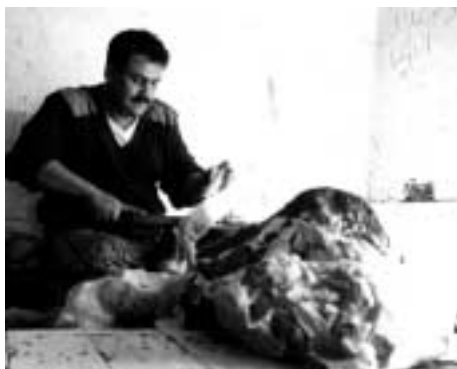
スークに働く人々。肉屋（サナア新市街）、鍛冶屋（サナア旧市街）、ひき臼屋（アムラン）。ただし彼らはすべて常設市に店を構えている人々であり、行商人ではない。

という他者に依存しなければ生きていけないからであるらしい。こうして行商人、床屋、肉屋などスークで生計を立てている人（「スークの民」アハル・アル・スーク）は、カビリーより半歩ほど劣った階層に属すると見なされるのである。