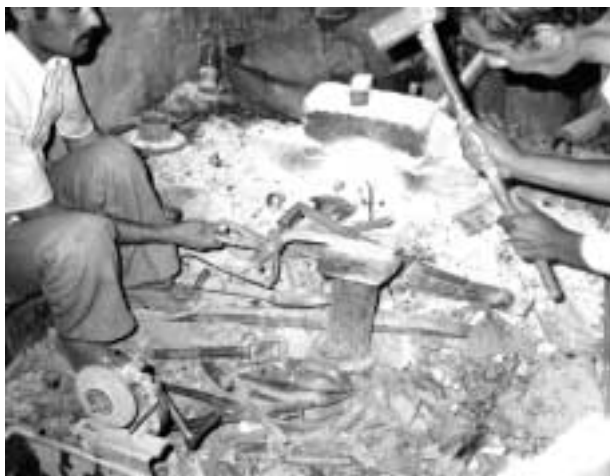
鍛冶屋（サナア旧市街地）

行商人は月曜スークのある場所から、火曜スークの場所、水曜、木曜と順繰りにめぐり歩き、一週間後にまた同じスークに戻って来る。ある程度の広がりの地域のなかには同じ曜日に開催されるスークが二つ三つある場合もあり、商人はそれぞれの顧客、ニーズに応じてどのルートをとるかを選ぶことができるので、すべての行商人が同じルートをたどっているのではない。しかしそれぞれの行商人の一週間のルートは固定されているので、買い手にとっては毎週同じ商人が同じ品