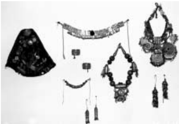
嫁入りのための銀製品一式。左から時計回りに頭巾、額飾り、胸飾り、イヤリング、首飾り、プレスレット。