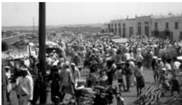
ティハマ最大の金曜市，ベイトル・ファキーフ