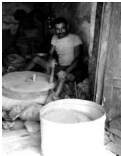
ひき臼屋（アムラン）

行商人の一週間のサイクルのなかには比較的規模の大きい地域の中心的なスークが含まれている。こうしたスークは、地域の物流センターの機能を担っているので、たいていの