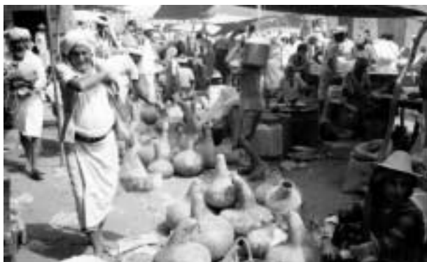
ベイトル・ファキーフの金曜市。ひょうたんはヨーグルト作りの容器となる。女性のかぶっているのはデーツの葉で編んだ帽子である。

スークは基本的にどこかの部族の領域内で開催される。普段はよそ者が招かれもせず、他の部族の領域内を通過すればさまざまな危険をともなうが、スークの行き帰りである場合には、スークを主催する部族はその顧客（他部族民であつても）の領域内の通過の安全を保証しなけ