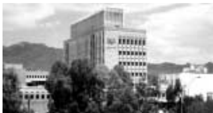
イエメン中央銀行。他の政府機関よりもより「近代的」な建物である。