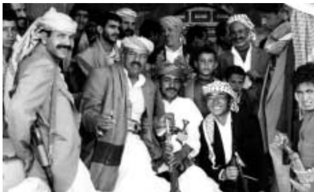
結婚式の記念写真。花輪のついた頭布をかぶって金の剣を持っているのが花婿である。祝い客はザンナにマシャッタ、ジャンピーアとライフルが正装である。(サナハーンにて)

メン政府も、本来このような「蛮行」を禁じてはいるのだが、取締りの手が届くのはせいぜい都市までで、農村部では放置状態である。町では花婿を仕立てた行進のとき、ライフルの代わりの景気づけとしてよく爆竹が炸裂する。これは子供の役割である。しかしカビリーはこれで満足するわけがない。私の訪れたある村では爆竹の代わりに手榴弾、ゴンボラ が登場していた。数人の少年がいくつかの手榴弾を腰にぶら提げ、信管をちぎっては道路脇の農閑期の畑に投げ、炸裂させる。「チュドーン」という音とともにサナア盆地の乾いた土が舞い上がる。現代の日本人なら手榴弾の土煙を間近に見ることは一生に一度もないかもしれない(というより、ライフル