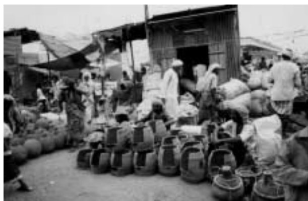
タヌール売り。これを逆さにして周りを土で固める。 (ペイトル・ファキーフにて)

家庭ではタヌールの火力は主として薪に依存している。そして水と同様薪の調達は女性の仕事である。日暮れ前の時間帯に山岳地を車で走ると、細い灌木の束を頭の上に載せて家路を急ぐ数人の女性の隊列を見ることがあ