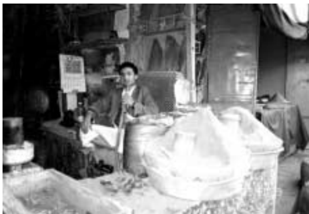
タバコの葉売り。背中にあるのがタバコの葉、手前に積んであるのは粉タバコ トゥンパーフ である。(サナア旧市街にて)