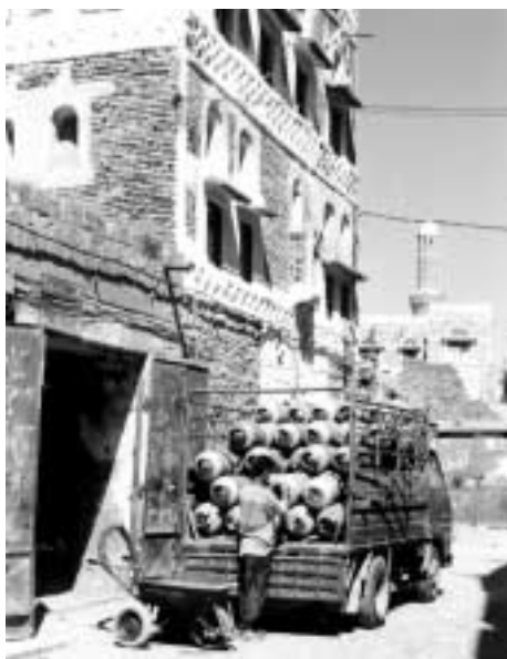
工場から市内の「配給所」に運ばれたボンベは顧客が買いに来るか、手押し車 アラペーヤ で小売りされる。(サナア旧市街にて)

りのキツク力が必要となる。そもそも充填されたガスボンベの重さは約三〇キロであり、日本人の男では数メートルをえっちらおっちら運ぶことはできても、道具なしに長距離を運搬することはできないだろう。しかしイメンではときには、女の子が水と同様頭の上