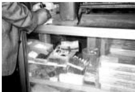
地方ではライフルの弾丸はガソリンスタンドや少し大きな村の電気屋等で電池と並んで売られている。日常的な消耗品なのだ。（ラダア近くにて）

しかしいつたい、これらの武器はどこから手に入るのだろうか。ライフル、ピストルは少し離れたジハナの「フリーマーケット」に行けば、よりどりみどりで手に入る。価格はそれほど高くはなく、公務員の給料の二、三カ月分で手に入る。フリーマーケット スーク・ホツル には政府の規制は及ばないので、それらの武器がどこから流れて来るのかは不問に付され（いずれにせよ、正規の輸入ではないこ