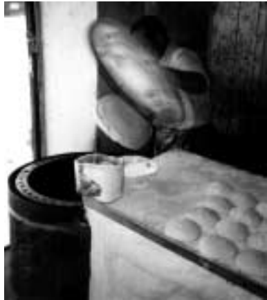
ガスタヌールでホブズを焼く。パン生地を右手に持った小さな座布団のようなものの上に薄く広げて左手で釜の蓋を開け、釜の内壁に張りつける。(マナ八にて)

これは新市街が成立する以前から続いている伝統あるスークのようである。一方、新市街にはこのようなスークもないので、さらに薪の入手は困難である。そこでホブズ焼きサイズスの鉄製の釜にガスバーナーをつくりつけた「ガスタヌール」が登場した。ちょっとかさばるが移動できるし、薪の心配も要らないので一九九〇年代にはそれなりに普及してきた。ただし味は「薪で焼いたパンとは比べものにならない」とのことである。