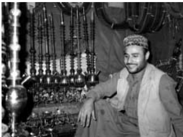
マダーア作り職人。ただし水溜めの部分はある程度できあがったものを買ってきて組み立てるようである。（サナア旧市街にて）

載せる。水パイプの本体は真鍮製で、サナア旧市街のスークにこれを商う専門の一画があり、真鍮部分に細かい模様が彫り込まれているものもある。この部分から長いホース（ときに二〇メートルくらいのももある）が出ていて、その先端についた吸い口で回し喫みされるのである。マダーアは部屋の真ん中にでんと置かれ、ホースをリレーすることによって部屋中の人が順番にタバコを吸うことができる（一〇ハペーシの写真参照）。マダーアの上で燃やされたタバコの煙はパイプに吸い込まれて水溜めのなかの水の上を通過してホースに導かれ、長いホースを経由して喫