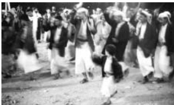
結婚式のジャンピーア・ダンス。花嫁側の男たちも加わって、踊りは最高潮である。小さな子供も見よう見まねで自分たちの部族のステップを覚える。(サナハーンにて)

この日の結婚式のメイン会場となる広場には明らかに軍のものとなる発電機つきトラックが活躍していたので、大規模な武器は軍の高官からの「貸与」であった可能性はあるが、重火器もその気になれば購入できる。サウジとの国境近くサアダの町の郊外にある「スーク・テルフ」と呼ばれる木曜市は武器スークとして有名で、ここではバスーカ砲を手始めにさまざまな重火器が手に入り、地对