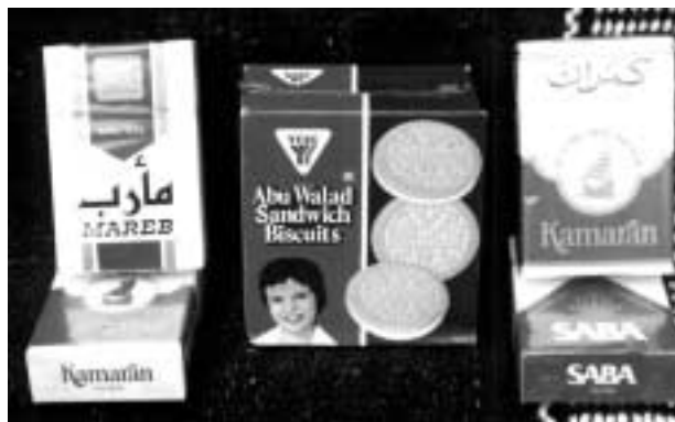
タバコとアブーワラド。イエメンの2大工業製品である。

ところで数種類ある国産タバコの命名には政治の色が濃くつきまといっており興味深い。旧北イエメンの代表銘柄「カマラン」はホデイダの沖合に浮かぶ紅海上の島の名である。かつてイギリスがアデンとその後背地を支配していた頃、ヨーロッパアジア航路の安全を維持する必要から、紅海・インド洋上の主要な島々もやはり支配下においていた。紅海の出口のバーク・