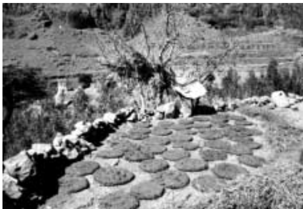
糞と草を混ぜ固めた燃料ケーキ。十分乾燥させてから用いる。(パニーマタルにて)

る。農作業の終わりに薪用の枝を拾い集めてきたのだらう。しかしイエメンの山にはそう木は多くないので、薪だけでは火力が足りず、これを補うために「糞ケーキ」ザムジ が利用される。これは家畜の糞（と人間の糞）にワラなどを加え乾燥させ、直径三〇センチくらい楕円形のケーキ状にしたもので農村の貴重な燃料源となる。雑食の人間の糞が混ざるとかなりの火力が得られるということである。農村では、天氣のいい昼下がりに家の壁や石垣にこの糞ケーキを張りつけて乾燥させている光景を目にすることができる。十分乾燥すれば、家の脇に重ねて積んでおいてもほとんど臭いは気にならない。