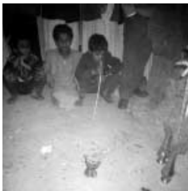
結婚式のザッファのときに焚かれる香。香台の右に見えるのが香草「レイハーン」で、花婿の両側に置かれるこの草にも香を焚きしめている。(サナア旧市街にて)

さて、シバの女王で有名なシバ王国は古代南アラビア諸王国の一つで、アジアと地中海世界をつなぐ「香料の道」を支配して栄華を築いた。なかでも乳香（フランキンセンス）と没薬（ミウルラ）の独占販売による利益は大きかったが、地中海世界でキリスト教が確立し多神教的祭儀がすたれると、神の「よりしろ」としての香料は急速にその需要を失い、これを契機にシバ王国は衰退していく。おそ