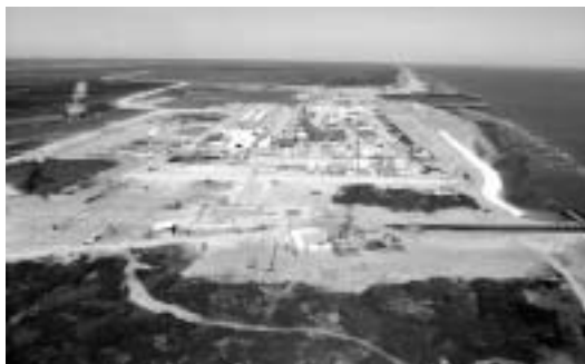
サハリンIで掘削中のYastreb(中央に立っている掘削リグ)