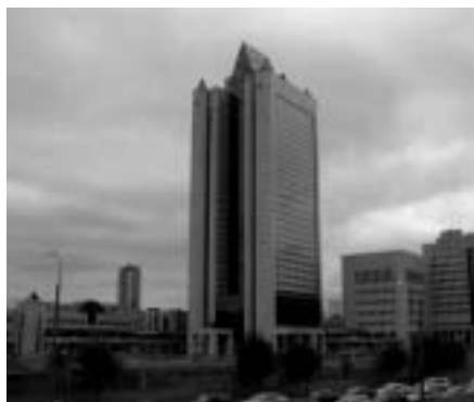
世界最大のガス会社、ガスプロムの本社：モスクワ

所、ガスプロム精製、ガスプロム北部修理、ガスプロム南部修理などの設立が承認された。つまり、ガスプロム内部の再編が行われることが正式に決まったことになる。