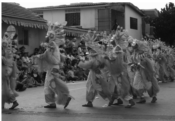
ユネスコの世界無形文化遺産に認定されている バランキージャのカーニバル

しかし、コロンビアの労働市場を見ると非正規労働者の割合は約六〇%と高く、必ずしも安定したまたは十分な所得が保証された就業状況ではない。