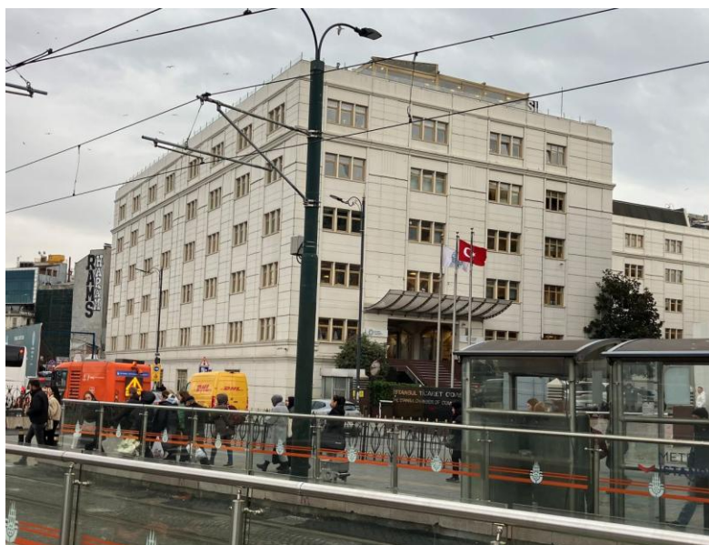
写真1 金角湾とボスポラス海峡を望む場所にあるイスタンブール商業会議所