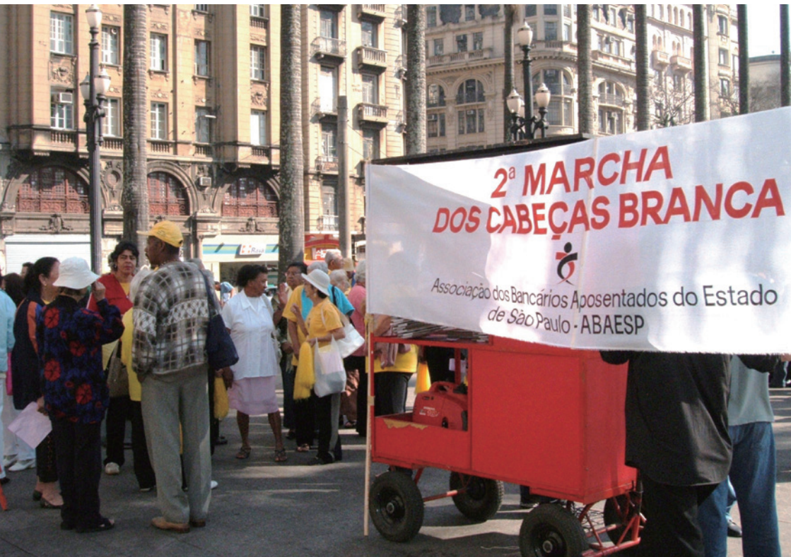
(写真) 年金制度の改善などをアピールするために集まった年金団体の高齢者たち (2008年)