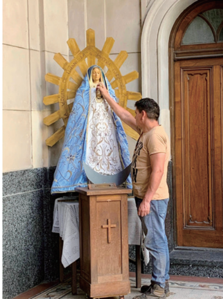
写真7-1 ルハンの聖母像に祈る信徒(2024年3月)

る露店が立ち並ぶ。最後の10キロメートルは仲間と手を取り合いながら這うようにして、どうにかルハン大聖堂に到着した。大聖堂の広場は巡礼者で埋め尽くされ、野外ミサが行われたが、眠りこけてしまい残念ながら何も覚えていない。後で聞いた話だが、毎年この巡礼に参加する屈強な人たちは、1年をとおして長距離を歩くトレーニングを積んでいるそうだ。ちなみにルハンまで行けない信徒のためか、ルハンの聖母像の複製をおくカトリック教会も少なくない(写真7-1)。