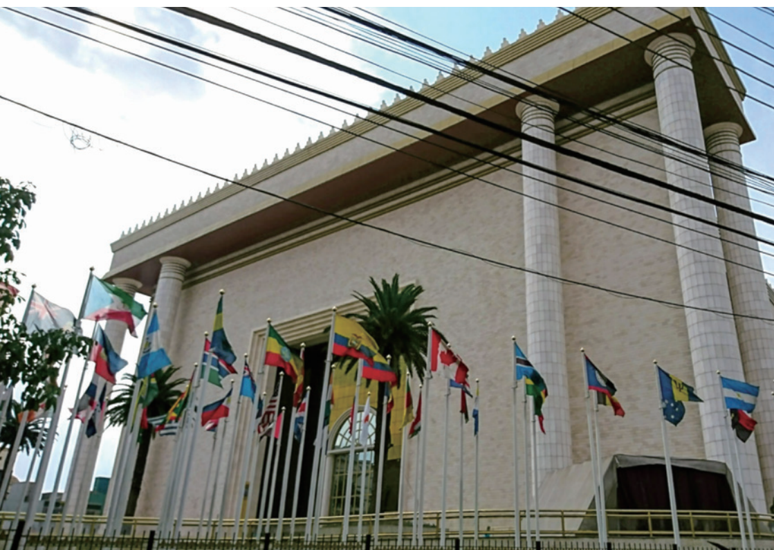
(写真) ブラジル・サンパウロ市内にあるキリスト教の新興プロテスタント福音派の巨大な教会 (2018年, 近田亮平撮影)