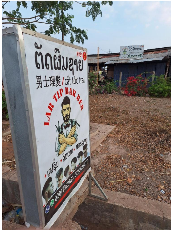
中国資本のサイセター総合開発区ゲート前の理髪店。 ラオス語、中国語とベトナム語の表記で「男性理髪」（2024年2月28日）