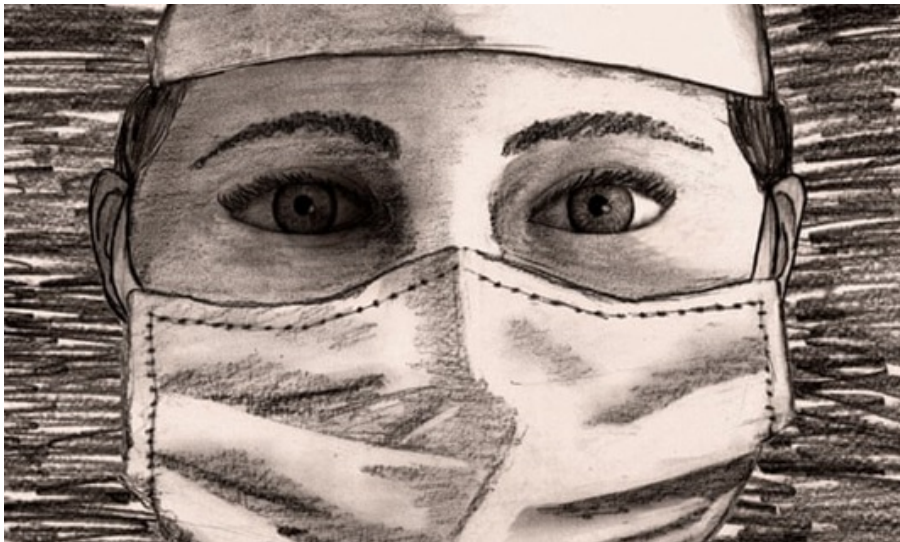
写真1 Lost on Front Line トップ画像

末尾に「※」印が記載してある資料はアジア経済研究所図書館で所蔵しています。リンクを開くと蔵書目録（OPAC）がご覧になれます。