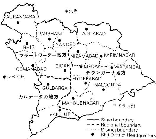
図2 ハイダラーバード藩王国

まず、体制側の政治組織として、1927年に設立されたムスリム統一協会 (Majlis-e-Ittehad-ul-Muslimeen) があげられる。この組織は、ムスリムの統合やその利益の保護を目的とし、ニザームとその体制を積極的に支持していた (注7) 。後にハイダラーバードがインドに統合されるにあたって、最も強く反発したのはこの組織である。