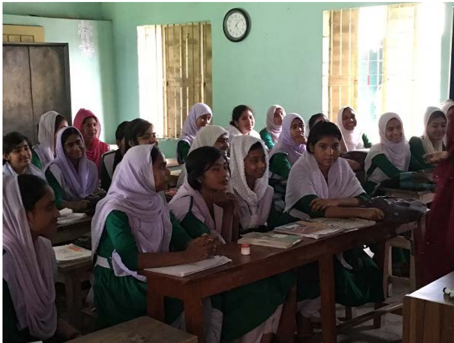
写真2 児童婚撲滅のためのエンパワメント・プログラム（バングラデシュ、2019年）