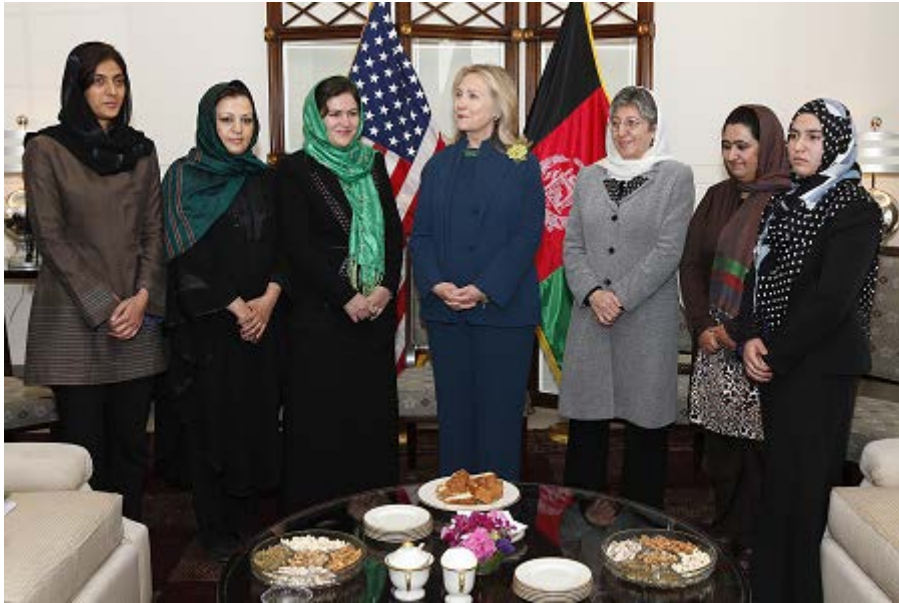
写真1 2011年クリントン国務長官（当時）がアフガニスタンの女性政治家と会談