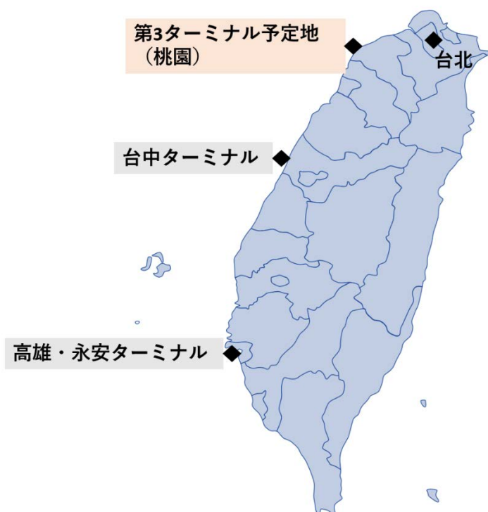
図2 既存の天然ガスターミナルおよび第3ターミナル建設予定地