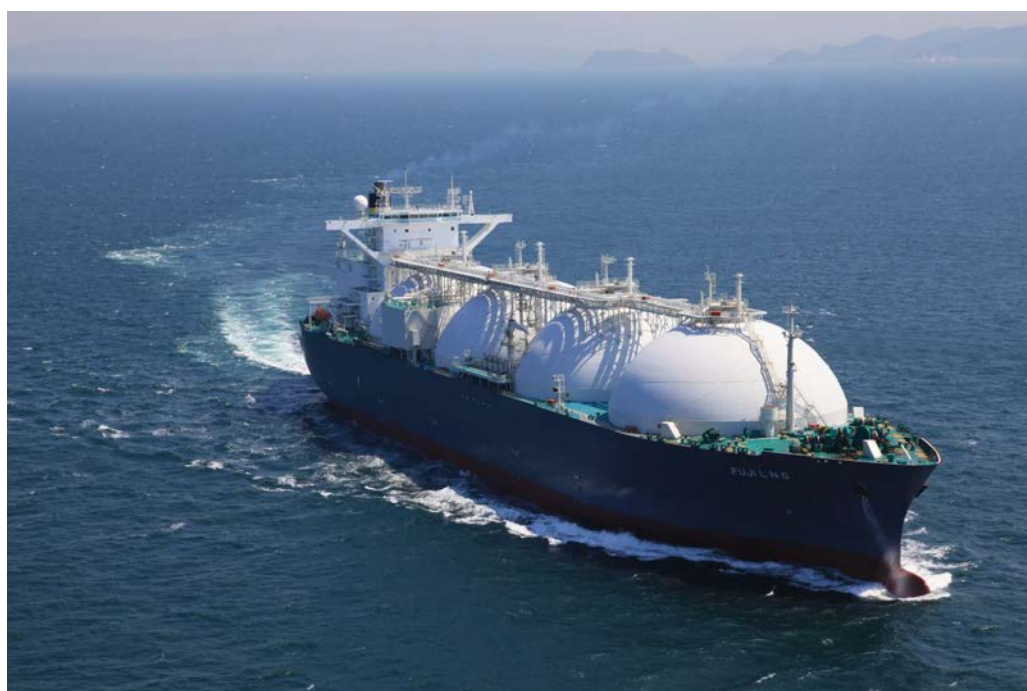
写真1 LNG 運搬船