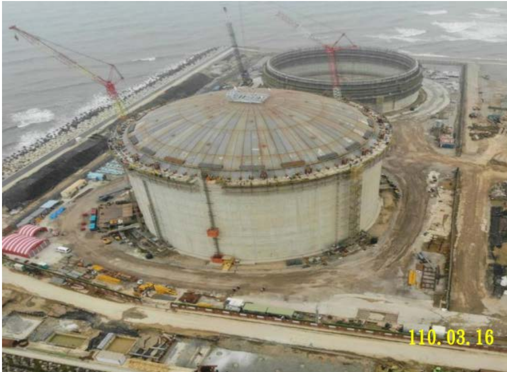
写真2 建設中の天然ガス第3ターミナル（桃園海岸沿い）