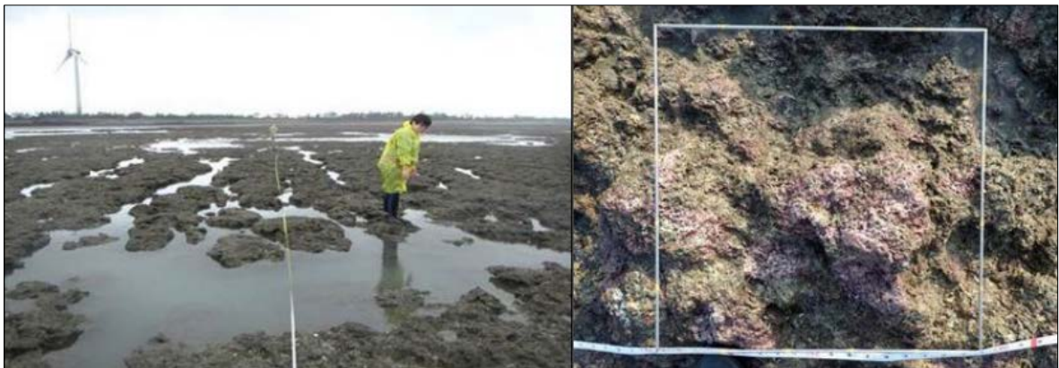
写真3 桃園海岸沿いにある藻類礁