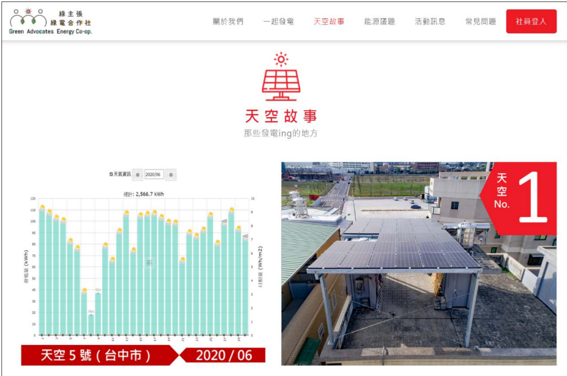
画像2 綠電合作社の発電事例をホームページにて紹介