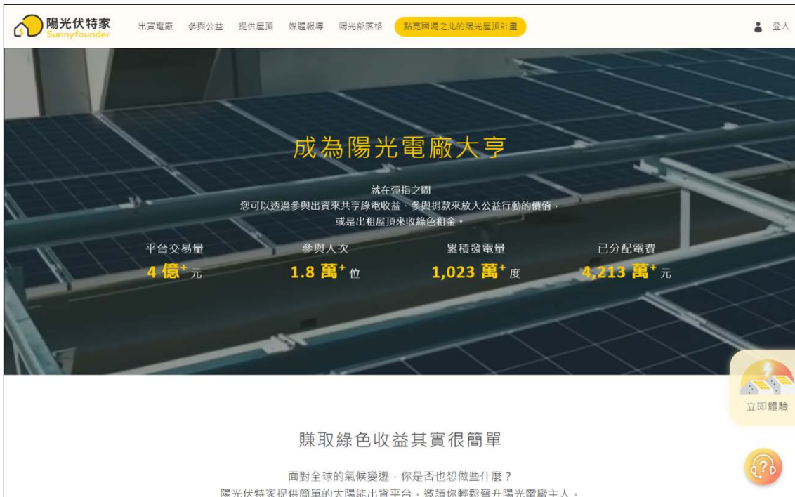
画像3 ホームページからでも簡単に購入申込できるサニー・ファウンダー実績などがわかりやすく書かれている