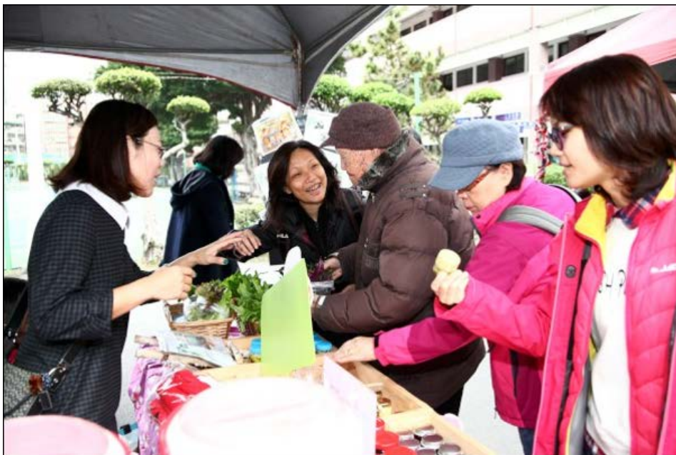
写真2 地域コミュニティが主催する参加型屋上農場販売イベント