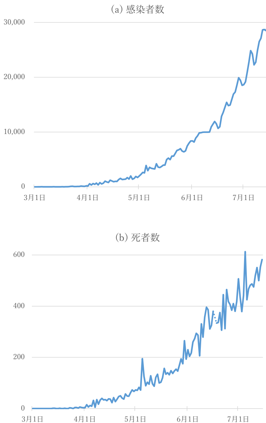
図2 インド国内での1日ごとの感染者数と死者数（2020年3月1日～7月15日）

(注) (b)の図では、6月17日のデータを除いている。これは、それ以前に死亡した人たちがこの日にまとめて報告され、死者数が2003人と極端に多くなっているためである。