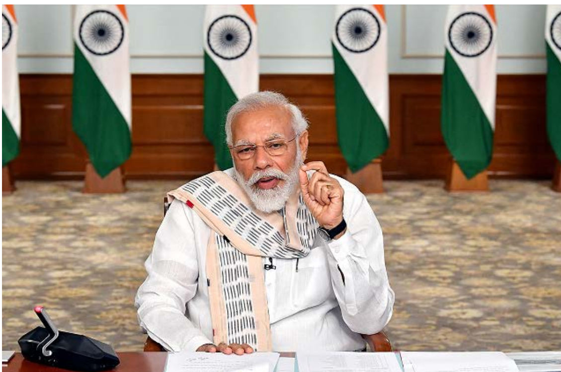
新型コロナウイルス感染症への対応を話し合うためのビデオ会議に出席するモーディー首相 (2020年6月16日)

31 この点については、Palshikar (2020); Varadarajan (2020)を参照。