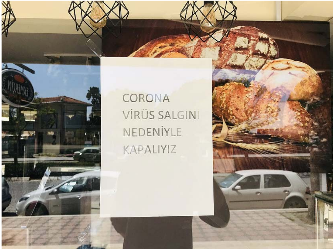
新型コロナウイルスの蔓延によって閉店を余儀なくされたパン屋