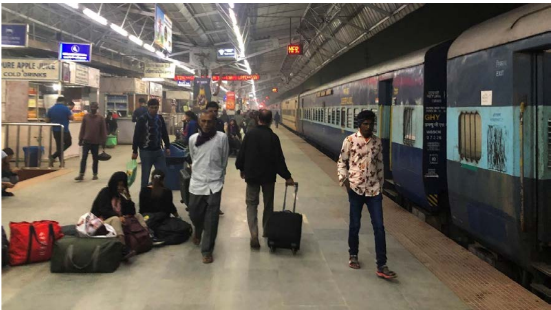
写真4 乗車待ちの人々