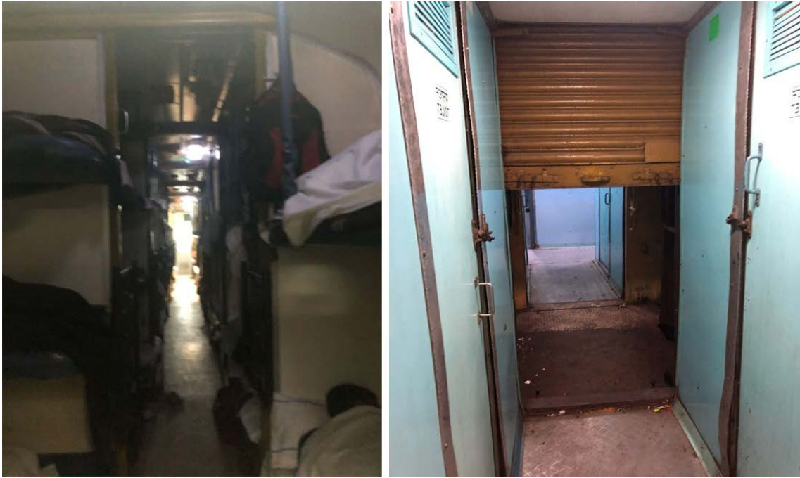
写真5 真夜中の寝台列車（左）と隣車両への通路（右）