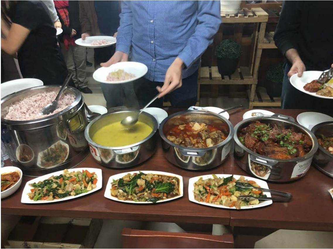
写真3 ナガランドの郷土料理