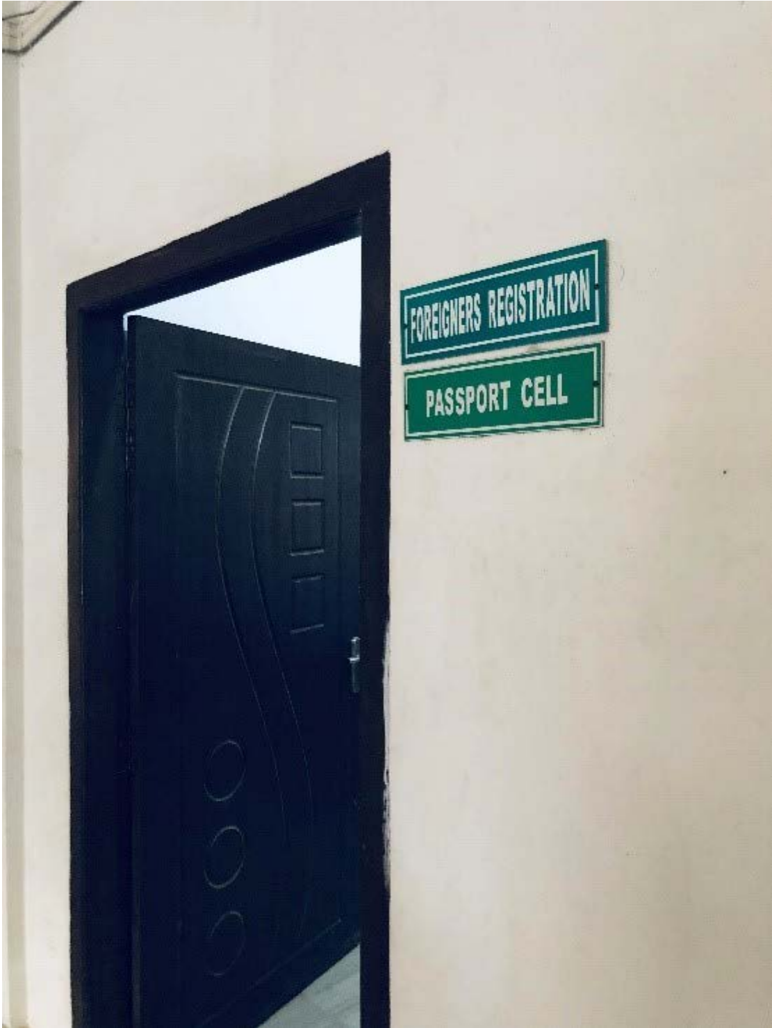
写真2 警察署の外国人登録窓口