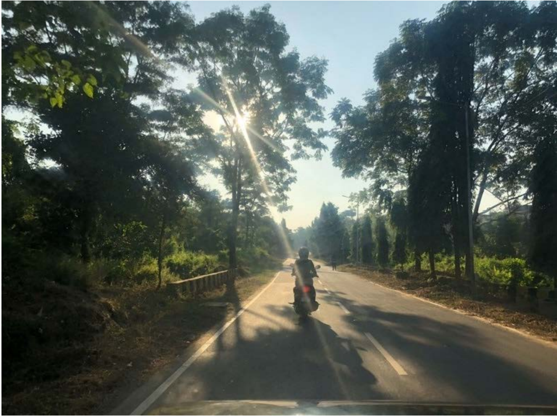
写真1 スクーターで先頭を走る警官