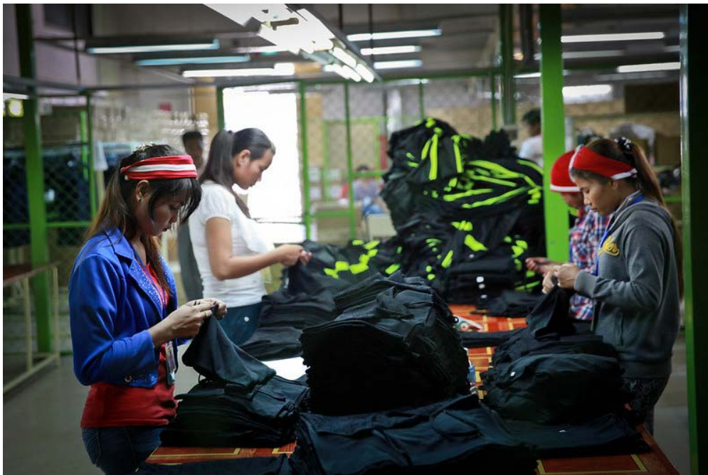
カンボジアの縫製工場働く女性たち