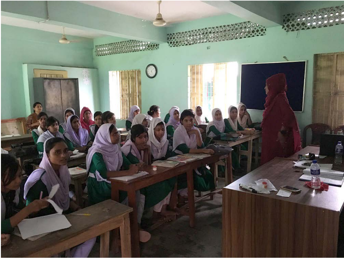
Bangladesh 児童婚撲滅プログラムのトレーニングの様子 (2019年7月)