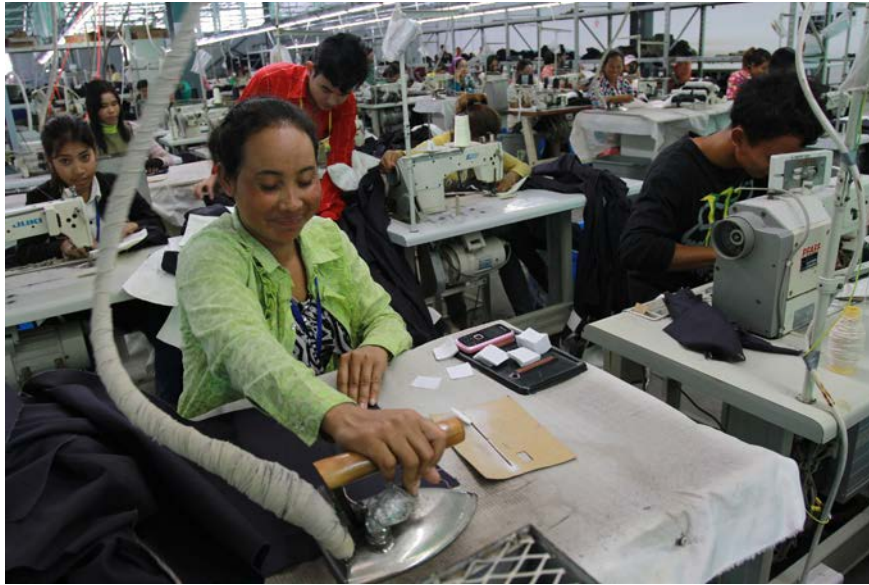
カンボジアの衣料工場