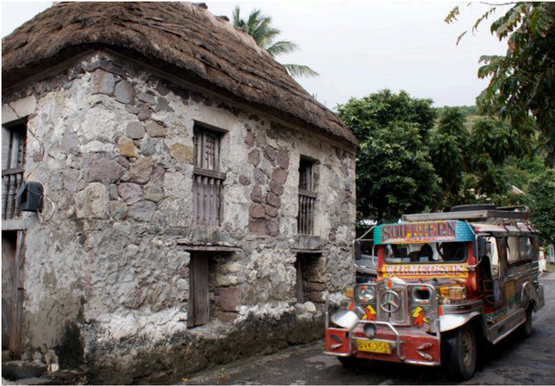
写真1 バタン島のストーンハウス