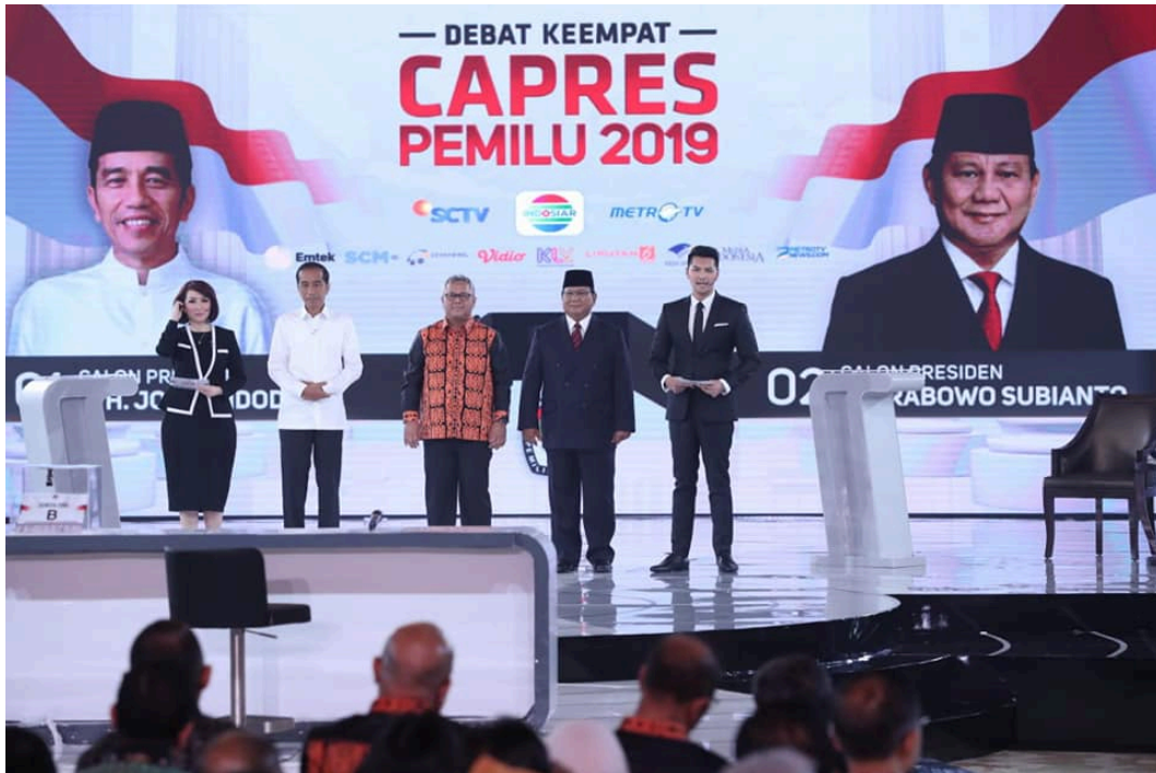
写真 2019年3月30日に開催された大統領候補同士の4回目の公開討論会