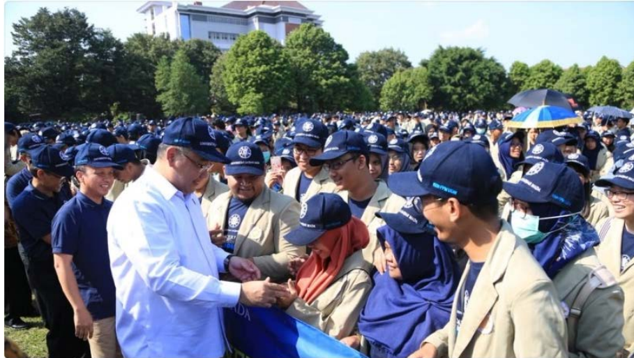
2018年ガジャマダ大学 KKN 壮行会の様子 村落・後進地域・開発・移住大臣が出席した

生たちが現地へ派遣される。彼らは一時的な簡易学校を開設し、被災し学校に通えない子どもたちの教育と心のケアにあたった。また、医学部の学生らは被災者の家をまわって彼らの健康チェックなどを行った 7 。