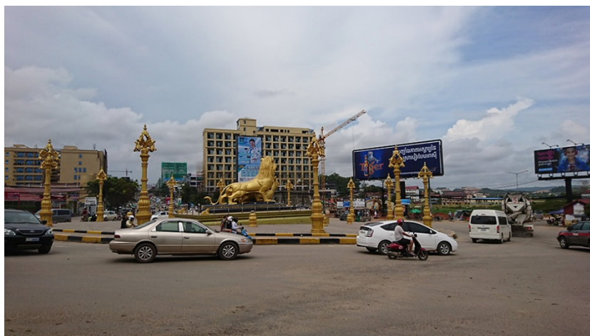
海辺の観光地シハヌークビルには中国人観光客向けのカジノホテルが林立する（2018年9月）

一方で、中国からの投資家や観光客などの増加によって生じたさまざまな軋轢は無視できないレベルに達している。中国人観光客が急増した海辺の観光地シハヌークビルは、彼らをターゲットとするカジノホテルであふれるようになった。つい2~3年前までカンボジア人や欧米人が欧米人観光客向けに経営していたレストランやホテルは、より高い賃料を払える中国人投資家によって中国人観光客向けの施設へと姿を変えていった 1 。このようななかで、中国人とカンボジア人とのトラブル、さらには中国人同士のトラブルが増加しており、飲酒に伴う喧嘩から組織的な詐欺、誘拐などの多くの事件に対して、カンボジア政府は対応に追われている 2 。急増する中国人に、受け入れるカンボジア側のキャパシティが追い付いていない様子が見え始める。