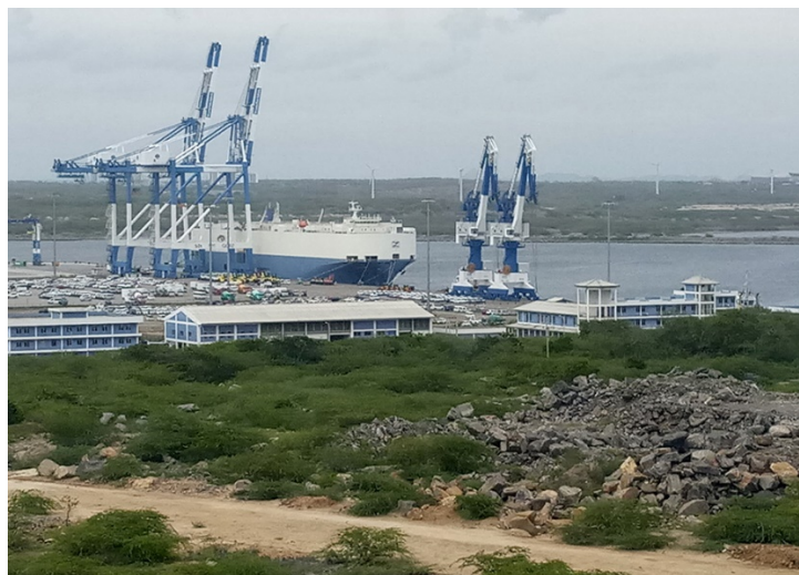
2017 年 9 月のハンバントタ港の様子。RORO 船から車両が積み下ろされている。クレーンは設置されているものの、RORO 船が主体であるため、ほとんど使用されていない

スリランカの名目 GDP (2017 年) は 871 億ドルである。それに対して政府の対外債務は 310 億ドルとなっている。ちなみにスリランカが 2008 年から 2018 年の間に中国から借り入れたのは 72 億ドルである 4 。これをスリランカは返済することができないでいる。なぜか。一つには、中国融資の条件が他の国や機関より厳しいからである。金利が 2% のものもあるが、なかには 6.5% に設定されているものもある。据え置き期間も短い。二つ目には、融資を受けて作られたインフラが利益を生んでいないことがある。コロombo首都圏とカトナヤケ空港を結ぶ高速道路は、確かに役に立っている。しかし、電力事情を一気に解消すると期待されていたノロッチョライ発電所 (8 億 9000 万ドル) は故障を繰り返している。マッタラ空港 (1 億 8000 万ドル) は世界一ガラガラの空港と言われている 5 。ハンバントタ港は 2017 年の一年間の寄港船数が 251 隻と惨憺たるありさまだった 6 。これらの操業による利益を返済に充てることは全くできないどころか、利益を上げているコロombo港などの稼ぎで赤字を補てんしている状態だったのである。スリランカ側は中国に返済の延期などを求めたが、中国側は聞き入れなかった。