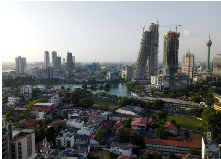
どんどん高くなってゆくビル（2018年3月）。右端にあるのは中国による電波塔。ビルが倒れかけているように見えるが、こういうデザインである。

ラージャパクサ政権時は中国からの資金を元手にしたインフラ開発が進み、好景気を下支えした。一方で現政権は、バランス外交を標榜して前政権との違いを明確にしようとしたものの、すぐに頓挫した。お金が足りなくなったからだ。そのせいだろうか、2017年の経済成長率は3.1%、南アジア諸国の中で最低だった。現政権としては、中国に借金を返し、中国から新たな融資や投資を得て開発をスピードアップして実績を作り、2020年の大統領選挙に臨みたいのだ。