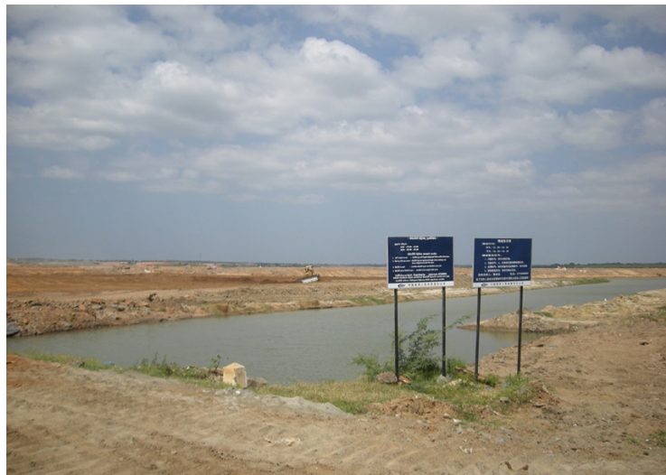
2009 年のハンバントタ港建設の様子。誰もいない建設現場

しかし、ハンバントタ周辺で農業を営む人口は圧倒的に少ない。ハンバントタ県の人口密度は 1 平方キロ当たり 240 人（2012 年センサス）で、コロombo 県（人口密度 3325 人）と 10 倍以上の開きがある。ハンバントタ周辺の人々の抗議は、中国に対する多額の借金返済に焦る政権によって無視され、中国からの直接投資や融資による開発の推進を求める大きな声にかき消されたようである。