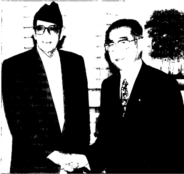
訪日したコイララ首相と小淵首相

なった。一方、野党側ではMLは他の左翼小政党とともに左翼9党同盟を結成し、4月27日に反国家法改正案反対のキャンペーンを行ったのを手始めに反政府デモを繰り返した。MLはNC政権に揺さぶりをかける一方で、MLと連立政権を樹立するようNCに持ちかけた。他方、UMLは6月29日に記者会見でNC政権への不満を表明し、閣外協力撤回の可能性を示唆した。さ