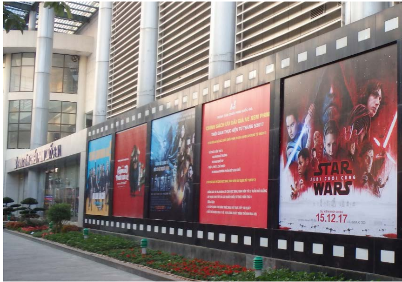
ハノイ市内の国家映画センター。「スター・ウォーズ 最後のジェダイ」は、日本と同じ2017年12月15日から公開された。

ベトナム系アメリカ人女優とは、ケリー・マリー・トランのことである 4 。彼女は、1989年1月17日にカリフォルニア州サンディエゴで生まれた。カリフォルニア大学でコミュニケーションを学んだ彼女は、ショートフィルムやテレビなどに出演していた。「スター・ウォーズ 最後のジェダイ」では、ベトナム人女優ゴー・タイン・ヴァン（後述）演じるベイジ・ティコの妹ローズ・ティコ役に抜てきされた。ローズ・ティコは、レイア・オーガナ将軍率いるレジスタンスに所属する整備クルーで、中心人物の一人フィンと行動を共にする。