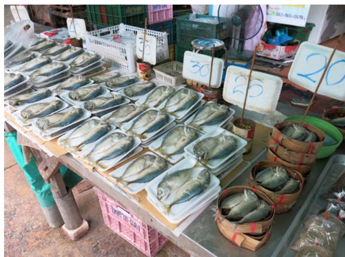
市場の店頭で売られるプラトゥー。

プラトゥーは、日本でグルクマと呼ばれる海水魚である。サバの仲間だが、短軀なのでむしろアジのように見える。隣のマレーシアやインドネシアではカレーに入れるようだが、タイでは、せいろで蒸してから一夜干しにしたものを揚げて食べることが多い。市場に行けば、干物を入れたせいろが山積みになっているし、スーパーでも、食品トレイに包装されて売られている。一流ブランド店の入った高級デパートですら、揚げプラトゥーの場違いな匂いが漂ってくることもある。フードコートの定番メニューだからだ。道端にはその場でプラトゥーを揚げる屋台が来て、仕事帰りや出勤途中の人々が匂いにつられて買っていく。日々の景色にいつでもちょっと顔をのぞかせているところも、日本のアジの干物を思わせて、親しみがわく。