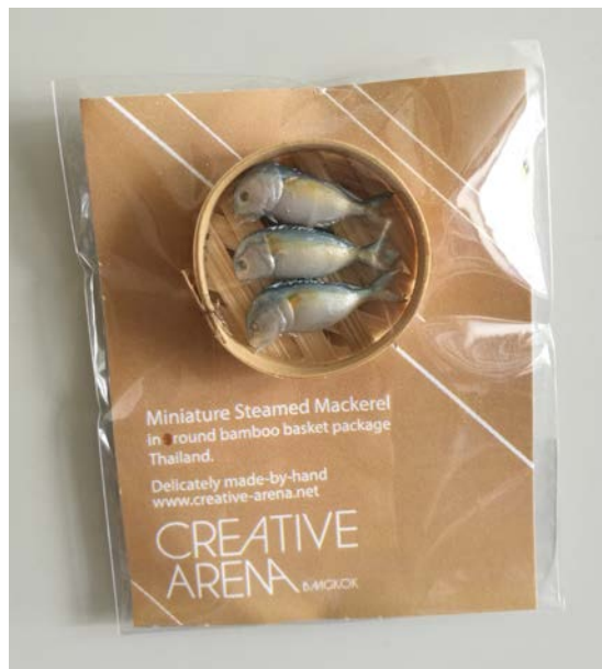
お土産用のマグネットになったプラトウ。やはりせいろ入り。

そんなプラトウの干物は、なぜかいつでも首を不自然に曲げてうなだれている。そのせいで、いやにしおらしく見える。狭いせいろに仲良く頭をたれて並ぶさまは、愛嬌すらある。タイ人もそんな姿を面白く思うのか、首をがっくり曲げてせいろに並ぶ様子をリアルに再現したお土産用のマグネットや、 うなだれた姿をそのまま巨大化した抱き枕 などの面白グッズもある。抱いて寝たら夢の中まで生臭くなりそうだが、それも厭わないということだろうか。