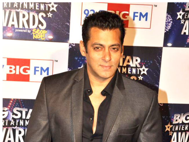
図 1 ハリウッドで最も成功している俳優の一人、サルマーン・カーン

そのうちの1人が、人気ハリウッド俳優のサルマーン・カーンである。数多くの映画作品に主演して次々とヒットを飛ばし、最近ではテレビのリアリティー番組の司会者としても好評を博しているという輝かしい経歴を考えれば、サルマーン・カーンが最も成功しているハリウッド俳優の1人であることに疑問の余地はない。ところがその一方で、裁判沙汰になるような事件を自ら起こしたり、無神経な言動や問題視されかねない行動を繰り返したりと何かと世間を騒がせることも多く、ネガティブなイメージが影のようにつねにつきまとっている 1) 。