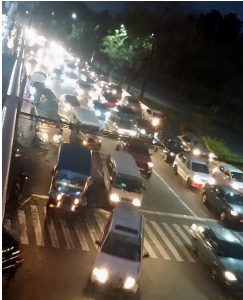
信号のない交差点が多く、渋滞をさらに悪化させている(筆者撮影)。

フィリピンで首都・都市部を中心に操業してきたのは Grab 社と Uber 社という 2 つの TNCs であった。Grab は東南アジアに軸足を置き、この地域に根差したサービスの発信を続けているという評判が特徴的である。他方、Uber は東南アジアに限定せず、世界的に展開しつつある。それぞれに独自の特徴があり、例えば Grab 社は現地の人びとが大好きな「プロモ」を上手に利用してきたように筆者は感じている。プロモは、日本でいうクーポンのようなもので、利用期間限定で値引きするコードを配信し、一日限定何名様まで、とあらかじめ指定し、需要を駆り立てる。利用者は値引き期間中にこのコードを入力して割引が得られる。忘れたころになるとまたコードが送られてくるのでまた Grab を利用する。段々と Grab のサービスを知るようになり、愛着が湧くユーザーを醸成している。自動車配車以外にもデリバリーなどサービスのバリエーションもある。