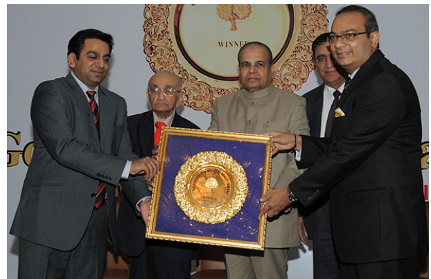
Prafullachandra Natvarlal Bhagwati (左から2番目) By Mahima Pillai (Own work) [CC BY-SA 3.0 ( https://creativecommons.org/licenses/by-sa/3.0/ )], via Wikimedia Commons

しかし、評価はそう簡単ではない。裁判官としてのキャリアを1960年にグジャラート高裁にて開始したバグワティはインディラ・ガンディ政権時代の73年7月に最高裁に就任している。当時、最高裁は政権と厳しい対立関係にあり、政権の展開する開発政策(農地改革や銀行国有化、藩王特権のはく奪など)を、最高裁は憲法に基本権として認められた財産権を侵害し違憲であるとする判