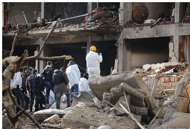
PKK により爆破された警察署での現場検証、ディヤルバクル、2016 年

地域共同体を重視する立場になっていることである。本稿では第 2 の理由、すなわち PKK の近年のイデオロギーと組織化戦略を概観し、それらのトルコやシリアでの有効性を考察する。