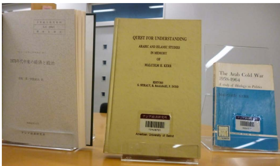
アジ研図書館にあるマルコムの研究書（2017年8月24日）

寛容と共生はスタンリーとエルサからマルコムとアンを経て、スティーブと彼の兄弟に脈々と受け継がれている。こうしたアメリカの良識は、カーの一家がバイルートをはじめとした異国で暮らした経験に根差している。アメリカが排除ではなく寛容と共生の方向に新たに舵を切っていくことを願って止まない。■