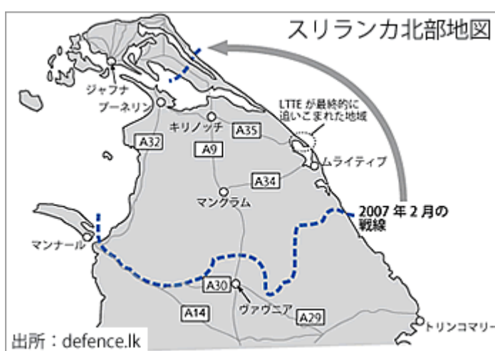
スリランカ北部地図

苦勞して連れてきたタミル人たちは LTTE の思惑通り「人間の盾」として最後まで LTTE を守った。LTTE はこうした民間人を人間の盾に利用しただけでない。14 才以上を兵士として徴兵していた。以前は家族から一人出せばそれ以上は免れていたが、戦争の末期にはそれも関係なく連れて行かれていたようだ。IDP の多くは食糧の不足する塹壕の中で弾丸と LTTE の徴兵に怯えながら過ごさざるを得なかった。LTTE はタミル人の唯一の代表、と主張し続けてきたが、LTTE は彼らを最後まで解放することはなかった。