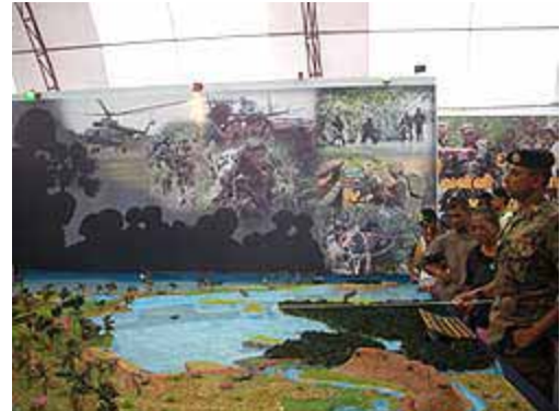
スリランカ軍60周年記念イベントで、戦地のジオラマの前に説明をする兵士

スリランカ政府側が低強度の戦争状態から決別したのは、LTTEの攻撃の強化に対応したものである。LTTEは、 2006年4月 にコロンボ中心部の陸軍病院に女性自爆テロを送り込み、陸軍トップのサラット・フォンセカ司令官殺害を試みた。7月にLTTEが東部バティカロア県北部で生活・農業用水に用いられるマウシルアル水路をせき止めたのを契機に、軍はLTTE殲滅に本格的に乗り出す。自爆テロによる負傷から回復したフォンセカが指揮を執った。大統領の弟で、軍を退職しアメリカに在住していたゴタバヤ・ラージャ