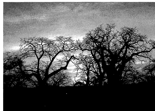
セネガルに生えるバオバブの木

それは言い過ぎだろう、と私は思う。自分の胸に手を当てて考えてみた。すぐに気づいたことは、私は他国の選手をまったく応援しないわけではない、ということである。周囲の目など気にせず奇声を発しながらバーベルを差し上げる重量挙げ選手、スタイル抜群で表情も変えずにスパイクを打ちつづけるバレーボール選手、途中まで先頭を走っているながら暴漢に襲われて泣きながらコースへと戻ったマラソン選手などは、外国人ではあるけれども、彼らが出場する試合をもう一度見るとき、おそらく私は日本人を応援するのと同じように彼らを応援するだろう。なぜなら既に私は彼らに感情移入してしまっているからである。一度彼らの立場に身を置いて考えることを経験すると、彼らの成功や失敗がなんだか他人事ではなくなるので